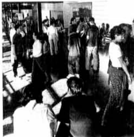
Estudiantes de la facultad de Empresariales de Sarriko

Los indicadores de calidad de empleo comparten una evolución posi-